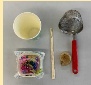
おゆまる・紙コップ・わりばし ざる・化石