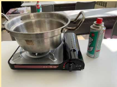
コンロ・ガスボンベ・鍋